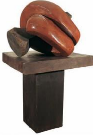
Resim 8. Abdülkadir ÖZTÜRK, Sonsuzluğa Geçiş, 121 x 55 x 32 cm, Ağaç, 2008.