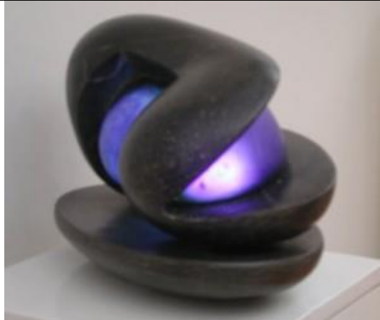
Resim 5. Abdülkadir ÖZTÜRK, Başkalaşan Dünya, 22 x 34 x 21 cm, Serpantin - Pleksiglas, 2001.