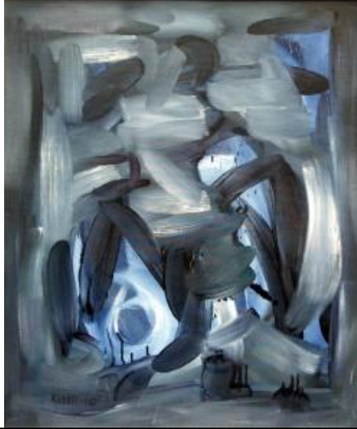
Resim 9. Abdülkadir ÖZTÜRK, İsimsiz, Tuval Üzerine Yağlı Boya Resim.