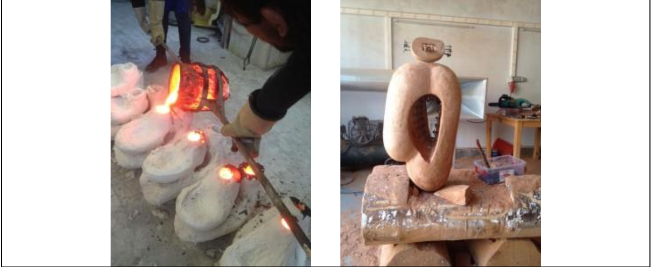
Resim 10. Abdülkadir ÖZTÜRK'ün Atölyesinden. 5