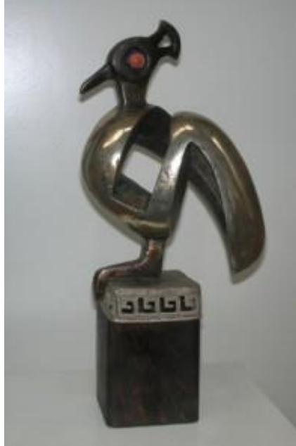
Resim 7. Abdülkadir ÖZTÜRK, Mitolojik Kuş, 38 x 8,5 x 16 cm, Bronz, 2002.