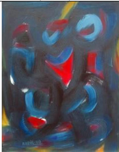
Resim 10. Abdülkadir ÖZTÜRK, İsimsiz, Tuval Üzerine Yağlı Boya Resim.