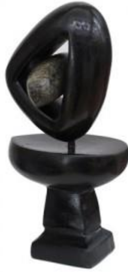
Resim 6. Abdülkadir ÖZTÜRK, Dengedeki İki Form, 28 x 14 x 9 cm, Diorit, 2009.