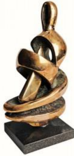
Resim 3. Abdülkadir ÖZTÜRK, Anaç İdol, 27 x 16 x 11 cm, Bronz, 2010.